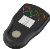
CONTROL REMOTO Opcional